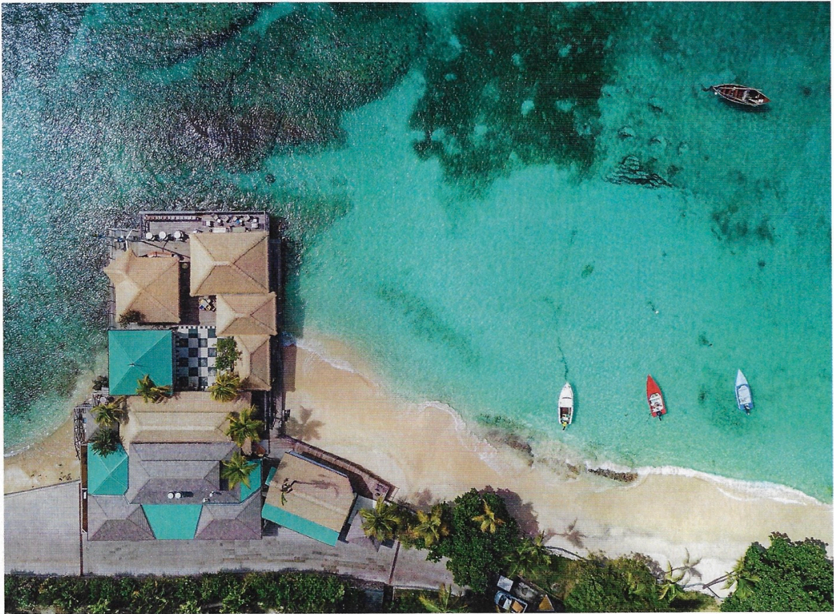
Legendäre Insel-Institution: Basil's Bar mit Livemusik und Open-Air-Meerblick