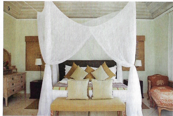
4. Kaffeepause unter Palmen: In der Sweet Pie Bakery werden täglich frische Insel-spezialitäten gebacken. 5. Karibische Leichtigkeit trifft in der Cotton House-Villa „The Residence“ auf entspannten Luxus